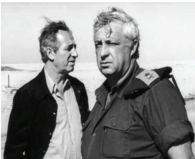
Peres con su compañero del Haganá, Ariel Sharón, en enero de 1975