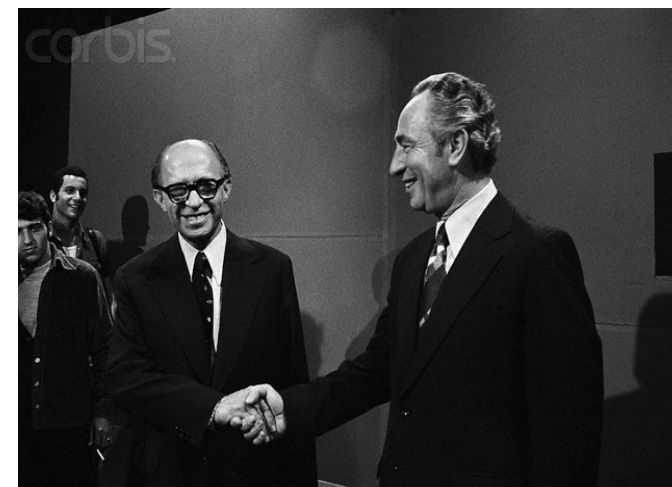
Dos jefes terroristas Peres (Haganá) y Menahem Begin (Irgún)

En 1953 a la edad de 30 años, Shimon Peres fue designado por el primero primer ministro, David Ben Gurion, para ser Director General del Ministerio de Defensa. En el transcurso de tres años Peres sentó las bases del programa de armas nucleares israelí.