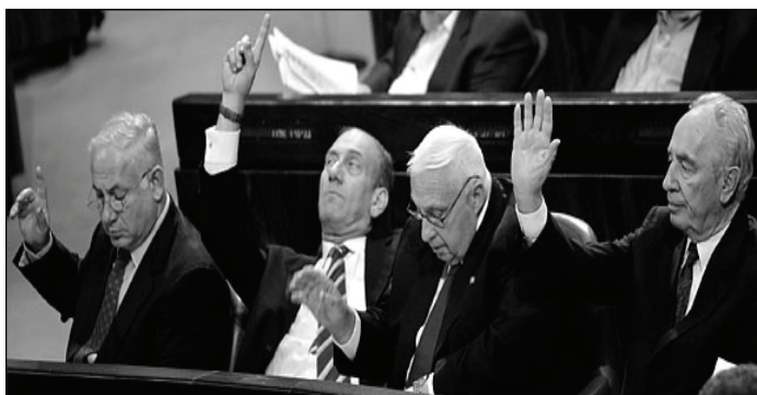
¡Sí! ¡Somos todos Terroristas! Netanyahu (Actual Primer Ministro) - Olmert (Saliente) - Sharon (antecesor de Olmert) - Shimon Peres (Actual Presidente)